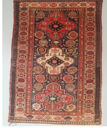
Xovlu yun xalça. 286×125. 1830-cu il. Gəncə qrupu. Xovlu yun xalça. 248×157. 1928-ci il. Gəncə qrupu.

Əvvəllər Gəncədə və onun ətraflarında istehsal olunan bütün xalçalar regionun adı ilə “Gəncəbasar” adlanırdı. Onların hər birinin özünün xüsusi xalça tipi olmasına baxmayaraq, Gəncəbasara aşağıdakı xalçaçılıq məntəqələri daxil idi: Samux , Fəxralı , Zeyvə , Çaylı , Aluşağı , Sarısu , Mollabazı , Balçılı , Qaracəmirlı , Şəmki , Gədəbəy .